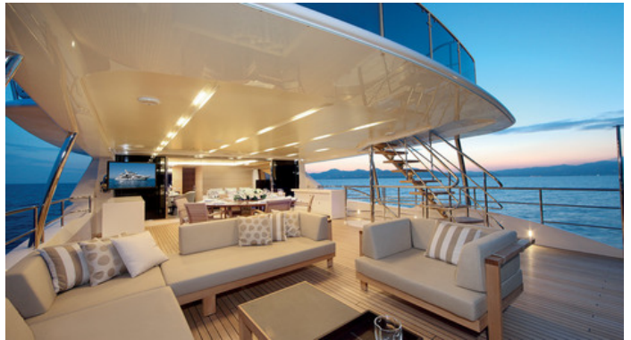
Кормовая часть верхней палубы