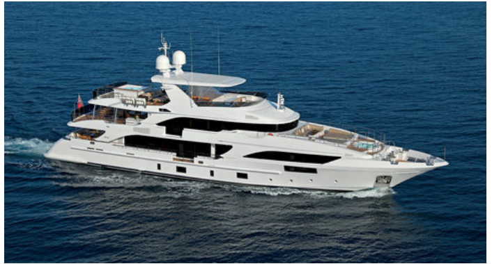
Экстерьер Benetti Supreme 132