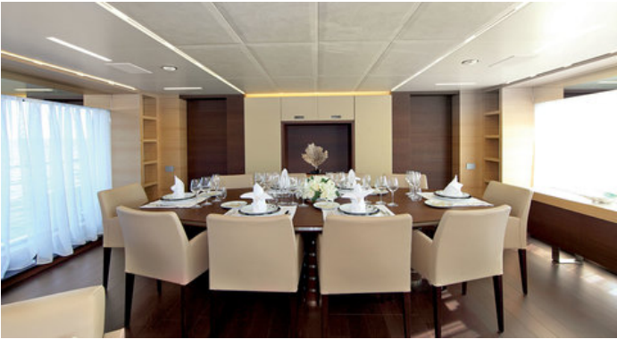
Обеденная зона в салоне на главной палубе