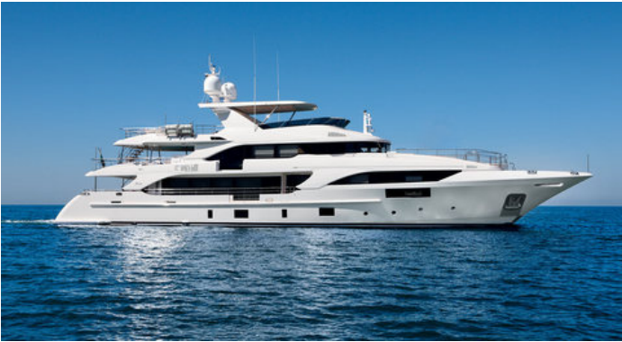
Экстерьер Benetti Supreme 132