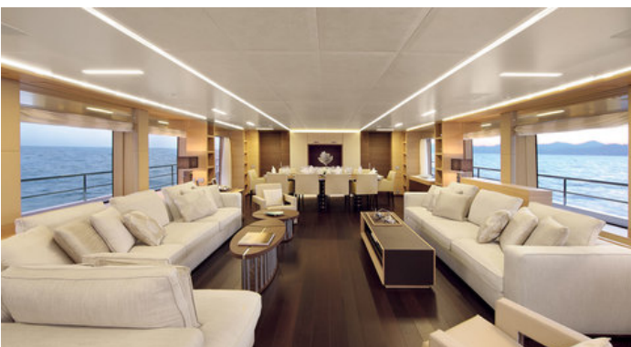
Салон на главной палубе