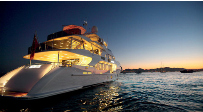
Экстерьер Benetti Supreme 132