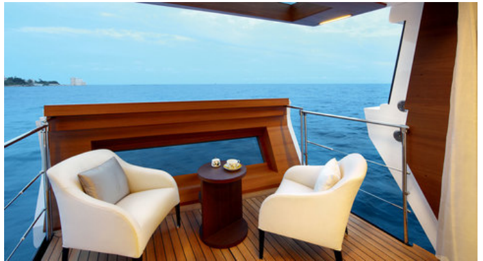
Балкон в каюте владельца