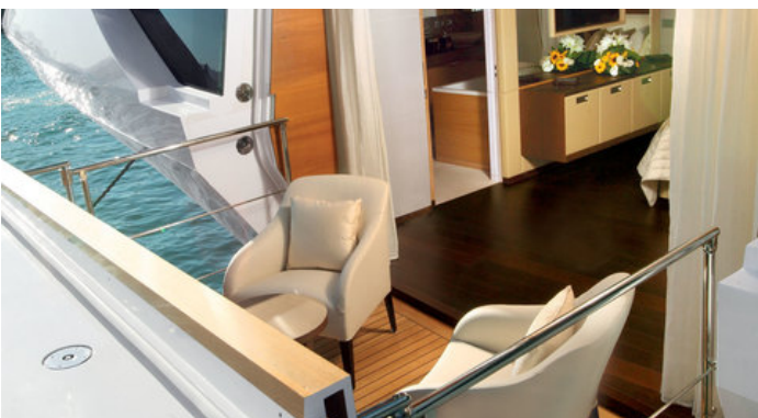
Балкон в каюте владельца