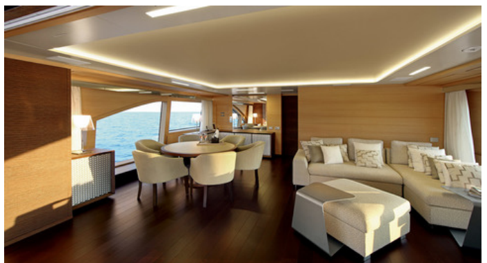
Салон на главной палубе