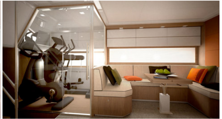
Третья каюта в исполнении "фитнес"