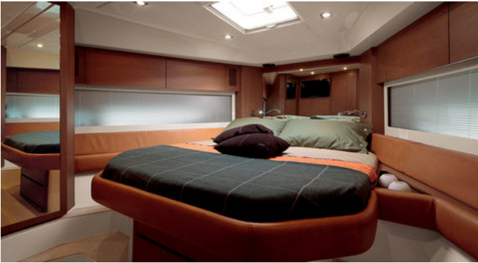
Носовая (VIP) каюта