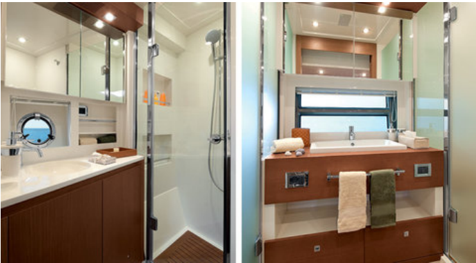
Ванная комната в VIP каюте и каюте владельца